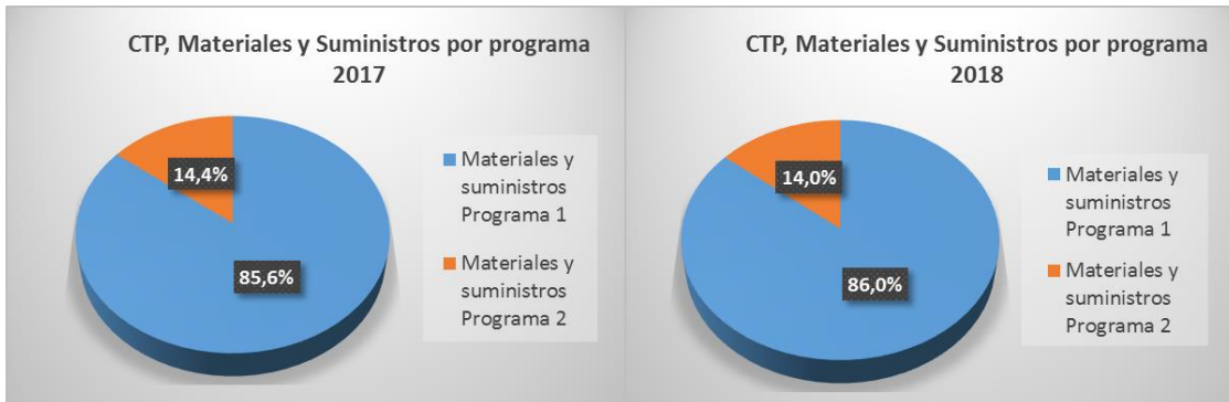
Gráfico 3 Proyecto de Cánones 2018 del CTP Composición de materiales y suministros CTP, por programa, 2017-2018

Puede apreciarse que la distribución del gasto de materiales y suministros entre los programas 1 y 2, en los períodos 2017 y 2018, se mantiene estable, con una participación dominante del Programa 1.