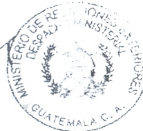
Harold Caballeros Ministro de Relaciones Exteriores

e. Consejo de la Unión Europea Secretaría del Sistema de la Integración Centroamericana (SG-SICA)